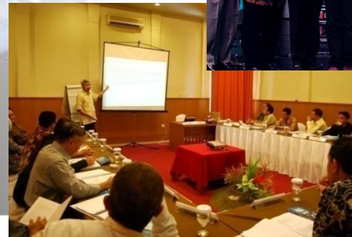
Continuing Professional Education Program untuk profesional yang dilaksanakan setiap bulan dan diikuti oleh berbagai profesional Indonesia.