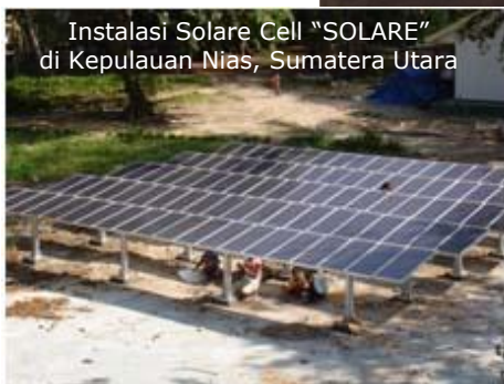
Instalasi Solare Cell "SOLARE" di Kepulauan Nias, Sumatera Utara