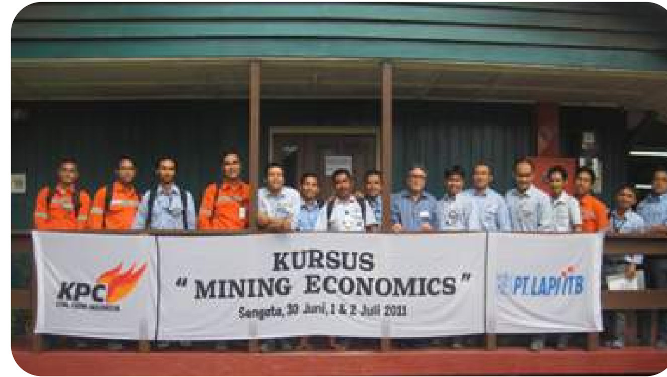
Mining Economic Training, KPC