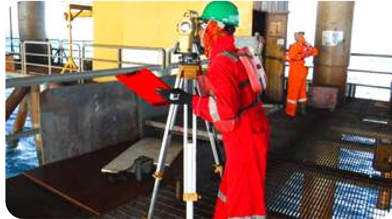
Engineering Services di Fasilitas Offshore