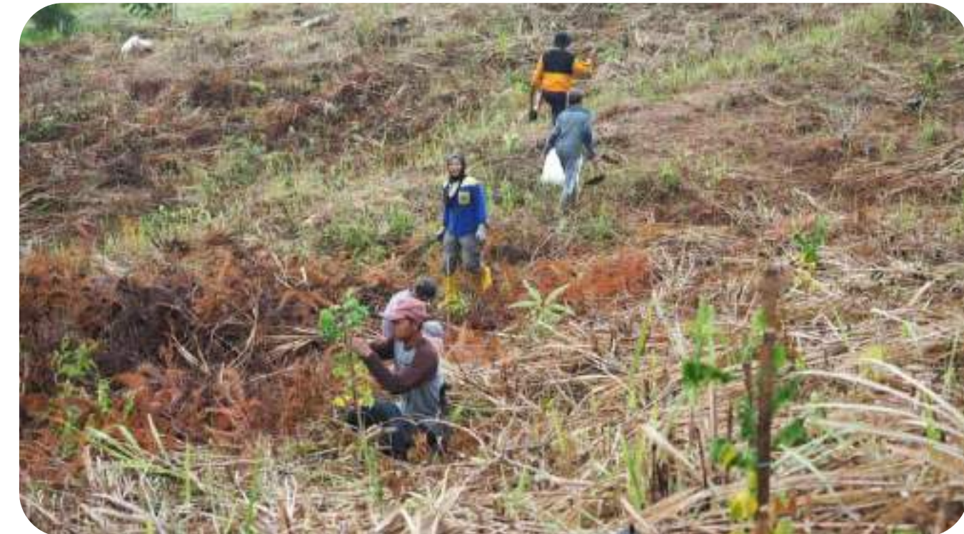
Kegiatan Penanaman Pohon di Hutan Konservasi Cikanyere, bekerjasama dengan Yayasan INARA

Dalam rangka untuk melaksanakan tanggung jawab sosial dan berperan serta secara aktif dalam menumbuhkembangkan masyarakat bisnis di Indonesia, PT LAPI ITB melakukan program pemberdayaan masyarakat, untuk membantu meningkatkan taraf kesejahteraan masyarakat melalui kegiatan ekonomi yang ramah lingkungan. Dalam melaksanakan kegiatan tersebut, PT LAPI ITB bekerja sama dengan Unit Kegiatan Mahasiswa (UKM) ITB dan lembaga lainnya yang bergerak di bidang sosial, pendidikan, dan lingkungan hidup.