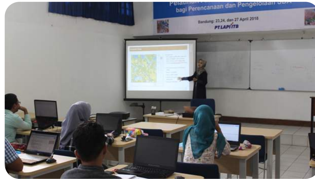
Pelatihan Analisis Data Kewilayahan bagi Perencanaan dan Pengelolaan Sumber Daya Air

Studi, survei dan investigasi, perencanaan dan desain, manajemen proyek dan supervisi