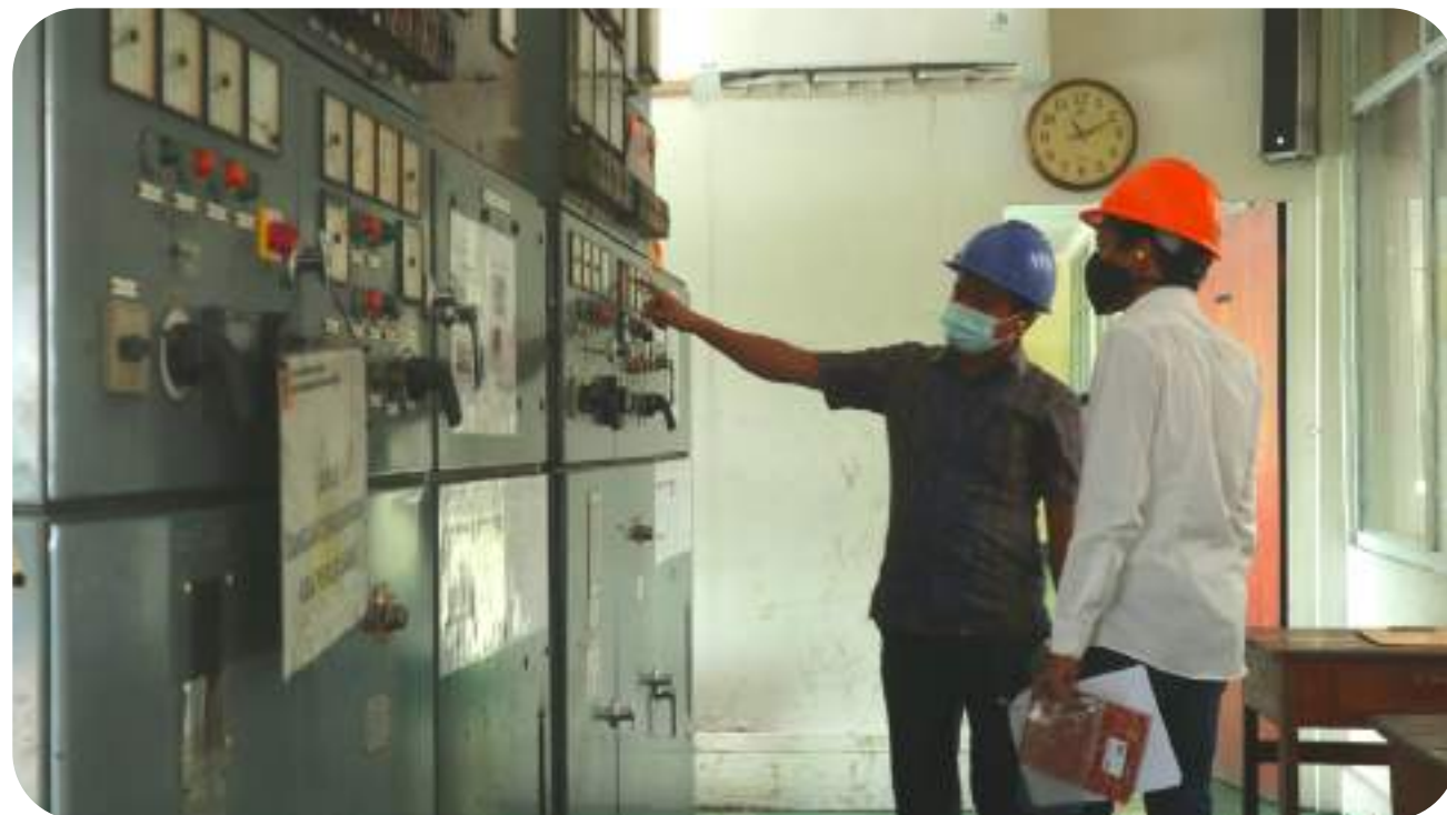
Kajian SFC Pembangkit