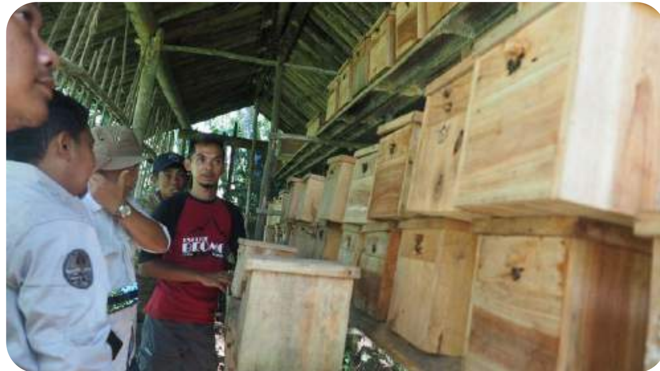
Kegiatan Pemberdayaan Masyarakat Kampung Bunikasih, bekerjasama dengan Yayasan INARA, IA ITB Jabar dan KMPA Ganesha ITB