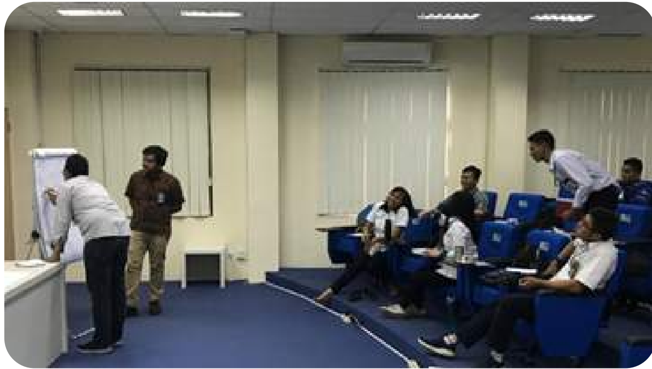
Workshop Life Cycle Assessment, PT Pembangunan Jawa Bali