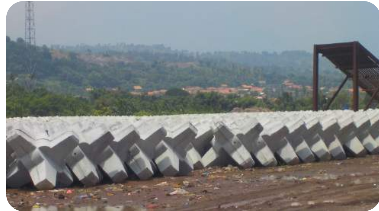
Implementasi breakwater "A-JACK" di Pelabuhan.