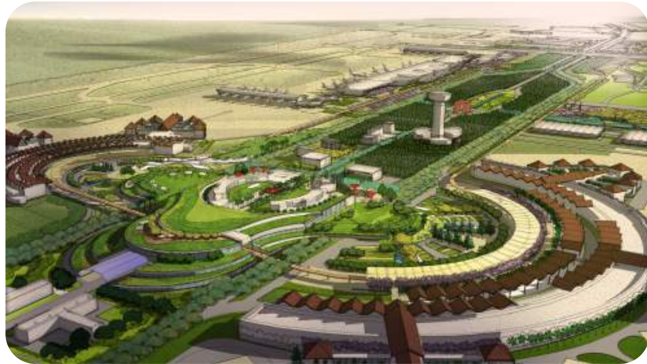
Basic Design Bandara Soekarno Hatta