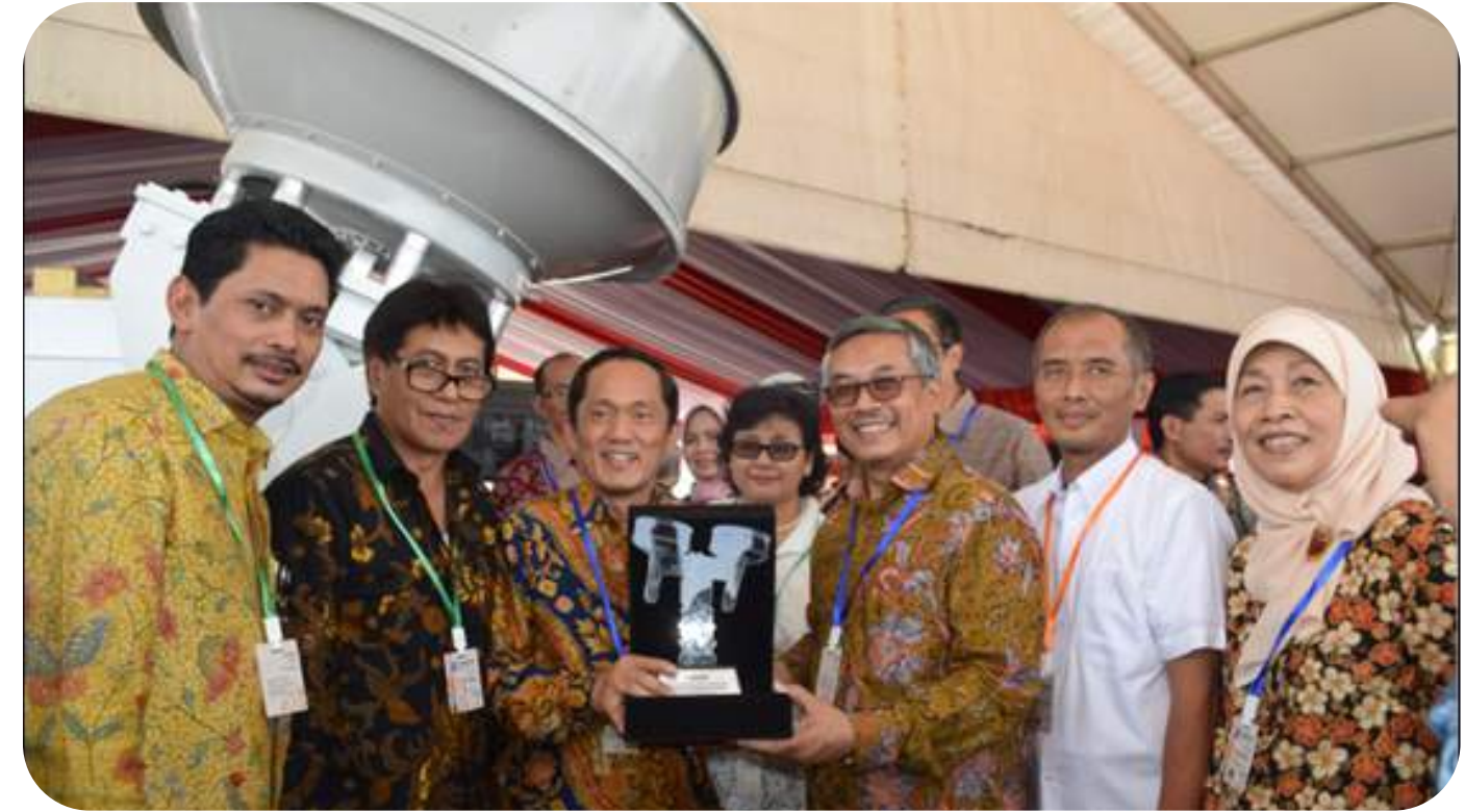
Kerja Sama dengan BUMN Nasional untuk Pengembangan Radar Cuaca

PT LAPI ITB telah melaksanakan kerja sama dengan berbagai lembaga dan perusahaan, yang meliputi: