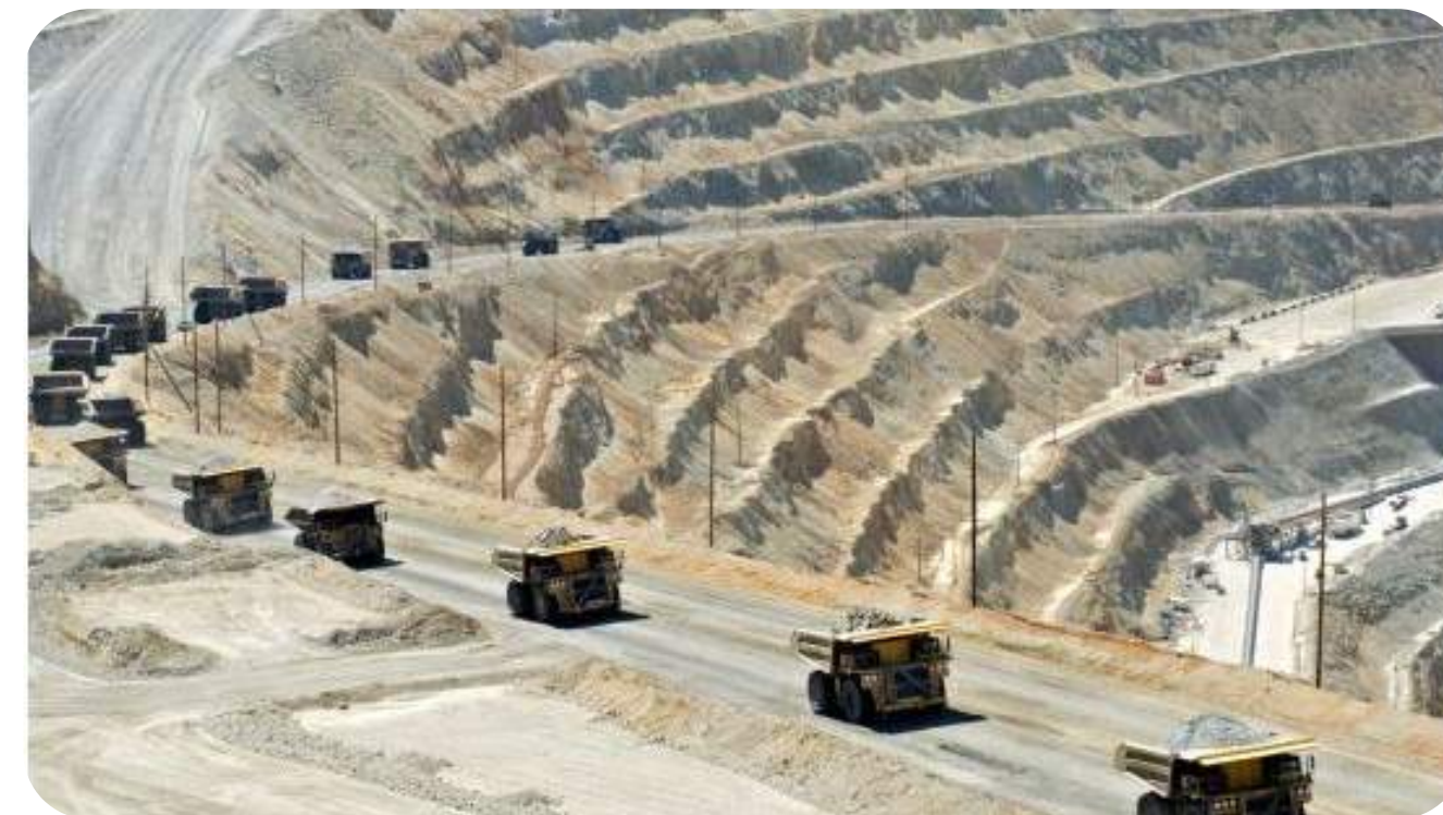
Aplikasi Collision Avoidance System (CAS) di Pertambangan