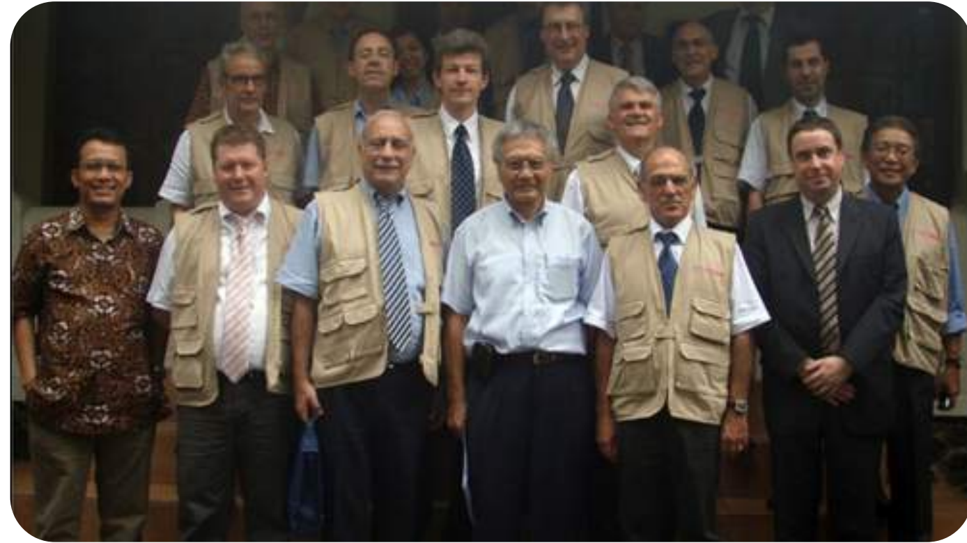
Kerjasama dengan SNCF-Perancis untuk Riset Mass Rapid Transport