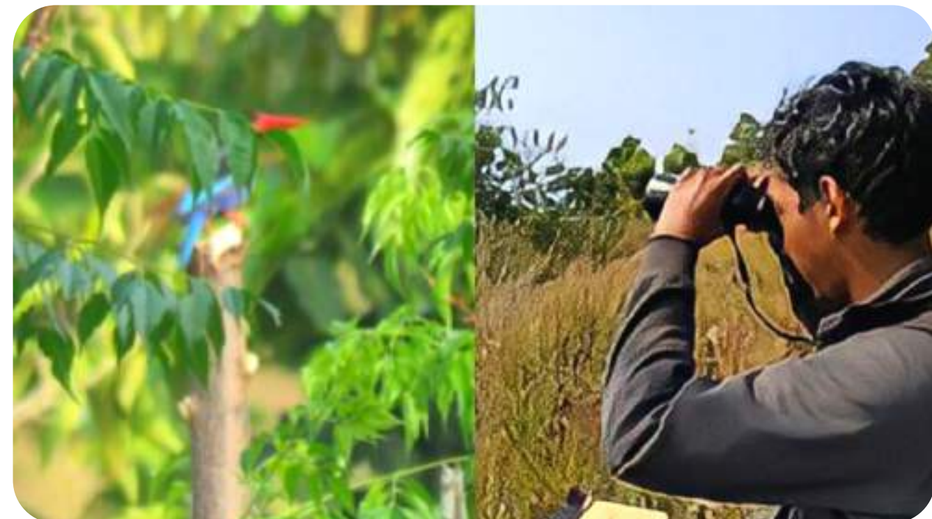
Studi Keanekaragaman Hayati