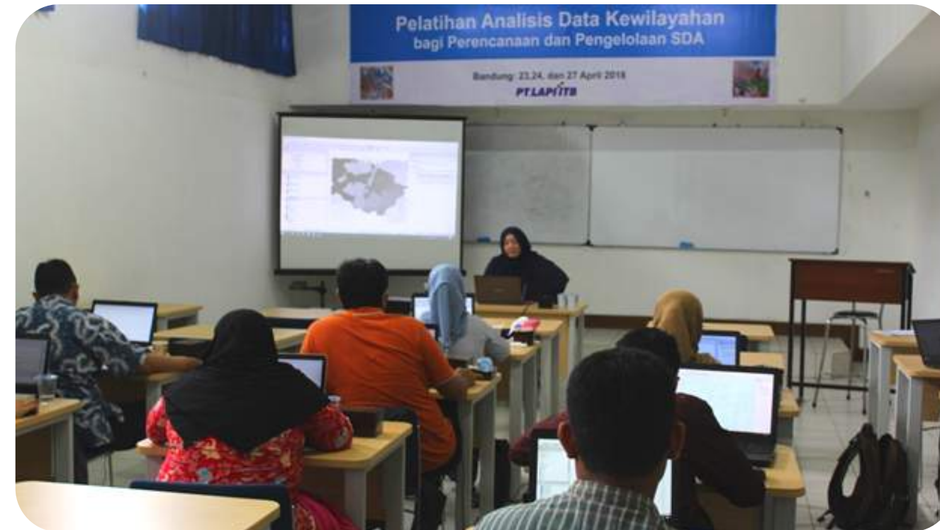
Pelatihan Analisis Data Kewilayahan bagi Perencanaan dan Pengelolaan Sumber Daya Air